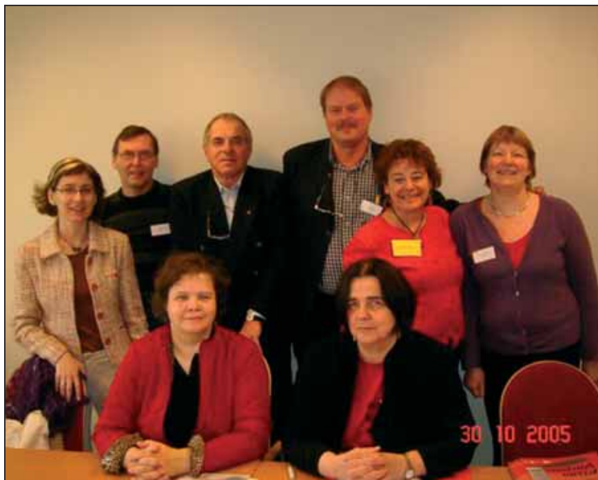
Nordiske repræsentanter fra Færøerne, Norge og Danmark

ungdomsafdeling og vores arbejde med ordblindpriser til særligt udvalgte af og i foreningen.